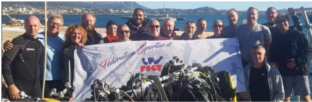
Stage Fédéral des Haut de France 2023